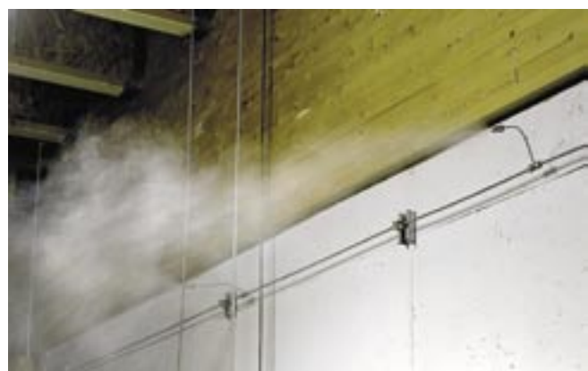
Système de contrôle de l'humidité